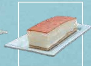
טורט גבינה אפויה קלאסית גם ללא תוספת סוכר