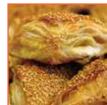
בורקס גבינה עלים

סוגים נוספים: בורקס תפוחי אדמה, קשקבל מבצק פילו, תרד מבצק פילו.