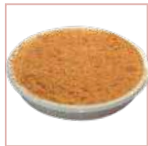
גבינה פירורים קרה גם ללא תוספת סוכר