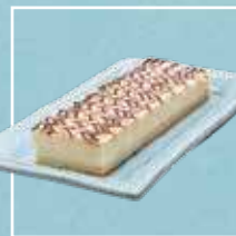
גבינה חלומית עם שוקולד לבן