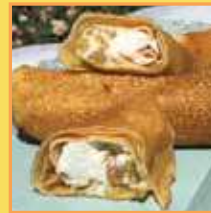
בלינצ'ס גבינה וצימוקים / ללא צימוקים