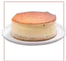
רנד גבינה אפויה עגול