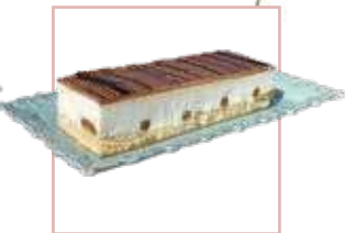
גבינה וריבת חלב