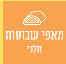
מאפי שבועות חלבי