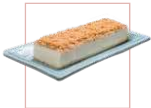
גבינה קרה פירורים / פירורי אוראו בטעם של פעם