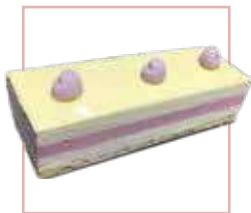
גבינה ומוס פירות יער