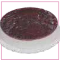
טורט גבינה אוכמניות