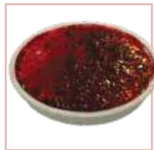
גבינה אוכמניות קרה גם ללא תוספת סוכר