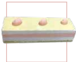
גבינה ומוס מנגו