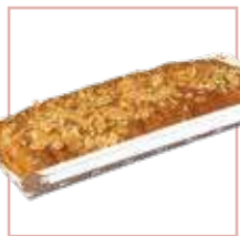
פס שמרים גבינה