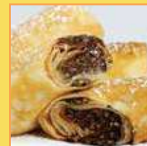
בלינצ'ס שוקולד ואגוזים