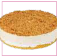
טורט גבינה פירורים