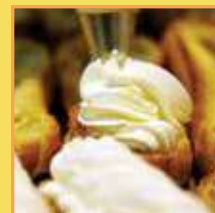
פחזניות במילוי שמנת מתוקה